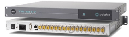
FIGURE 1: A 16x16 Trinity All-Optical Video Switch front and back views

V mnoha situacích jsou četné zdroje videa připojeny k vysílací centrále nebo vysílacím vozům pomocí omezeného počtu optických vláken, kde dochází ke konverzi signálu z optického na elektrický. S optickým switchem Polatis lze na dálku připojovat zdroje k zařízení pro zpracování videa ve vysílací centrále. Narozdíl od OEO switchů je Polatis nezávislý na protokolech a není limitován konkrétními datovými rychlostmi nebo typy signálů.